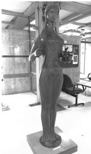
Alfredo Ceschiatti, Minerva , 1963.

Alfredo Ceschiatti se interessa muito pelo barroco mineiro, resgata alguns elementos dessa tradição em vários de seus trabalhos, aliando-os a uma maior simplificação formal. Ele explora a figura feminina por formas curvilíneas, puras e arredondadas. Sendo um dos escultores emblemáticos do modernismo brasileiro, concebeu Minerva (1963), que se encontra na Biblioteca Central da Universidade de Brasília.