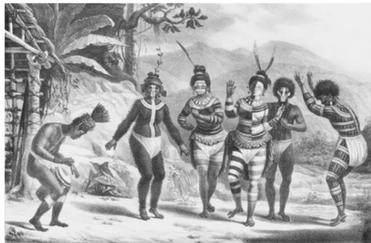
Jean-Baptiste Debret. Danse de sauvages de la mission de St. José, 1834.